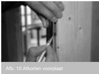
Afb. 10 Afkorten voorplaat