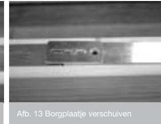
Afb. 13 Borgplaatje verschuiven