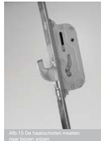
Afb.15 De haakschoten moeten naar boven wijzen

Belangrijk! Controleer goed of de haakschoten volledig open en dicht gaan.