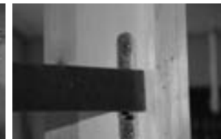
Afb. 5 Haaklijn markeren