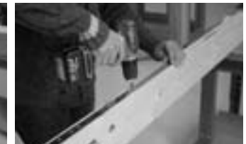
Afb. 3 Vastschroeven hoofdkast