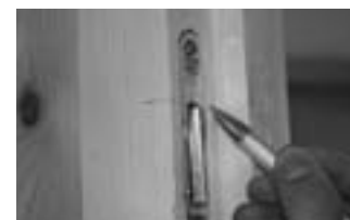
Afb. 6 Haaklijn markeren