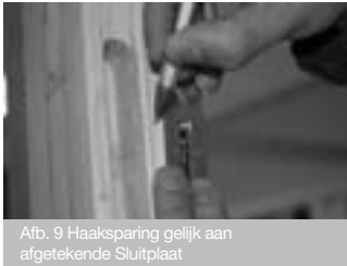
Afb. 9 Haaksparing gelijk aan afgetekende Sluitplaat