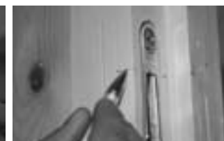
Afb. 7 Haaklijn markeren