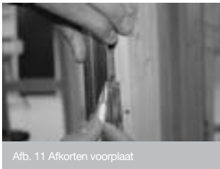
Afb. 11 Afkorten voorplaat