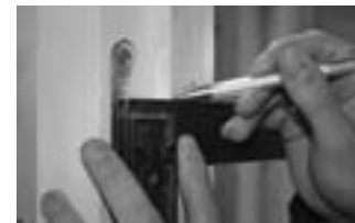
Afb. 4 Haaklijn markeren