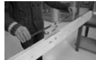
Afb. 1 Plaatsen hoofdkast