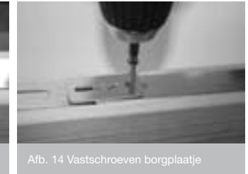
Afb. 14 Vastschroeven borgplaatje