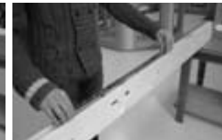
Afb. 2 Plaatsen hoofdkast