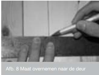
Afb. 8 Maat overnemen naar de deur